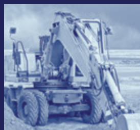
Grondverzet & Tuinbouw