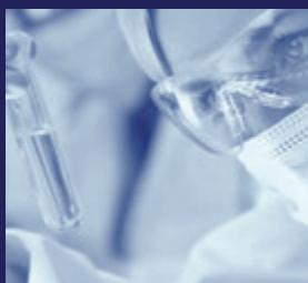
Pharma & Medische sector