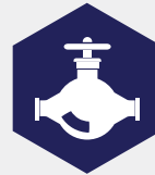
Appendages, slangen en koppelingen