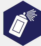
Onderhoud en reinigingsproducten