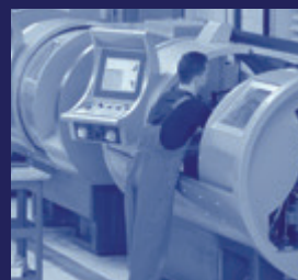
Machine & Apparatenbouw