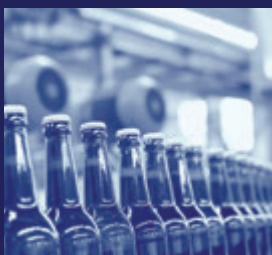
Voeding & Drank