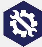
Service en onderhoud activiteiten