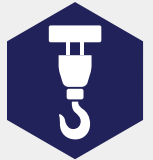
Hijs- en hefmiddelen