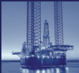
Chemie, Olie en Gas

& Tuinbouw, Machine- & Apparatenbouw, de Onderhoudsbedrijven en de ZZP ondernemers. Wij spelen in op de wensen van onze afnemers en bieden meerwaarde in diverse aanvullende maatwerkdiensten.