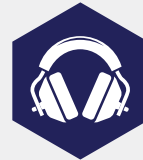
Veiligheid en ergonomie