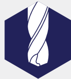
Tooling en verspaning